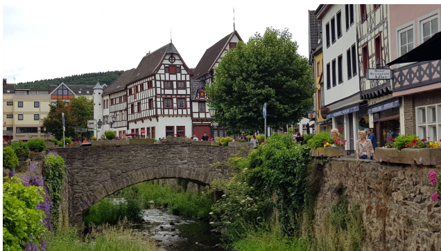
Bad Münster eifel,

Die IfKom-Studienfahrt 2020 in die Vulkaneifel war ausgebucht, die IfKom-Mitglieder der Bezirke Baden-Pfalz-Saar und Württemberg freuten sich auf die Reise. Leider machte uns das Coronavirus bereits im Frühjahr eine Strich durch die Rechnung und wir mussten die Reise komplett absagen.