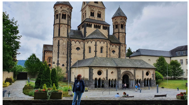
Kloster Maria Laach,