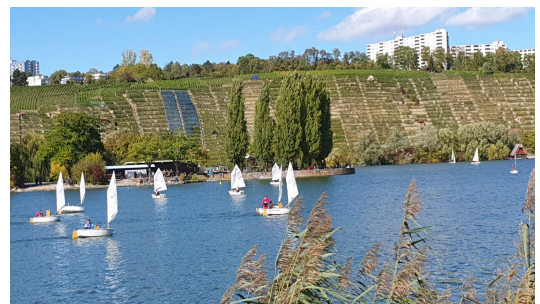
Max-Eyth-See im Oktober 2020 ,