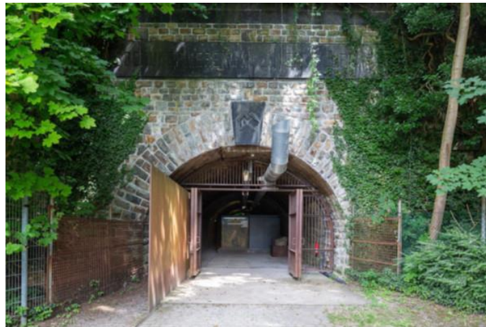
Eingang zum Zeittunnel